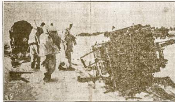
Raudonoji Armija užima vokiečių pozicijas, už kurias ėjo smarkios kovos. Laukai, aplinkui paliktus pabūklus, nukloti nacių kareivių lavonais.

Smith'o bilius delto yra ir re-akcinis ir pro-hitlerinis. H. Jagminas.