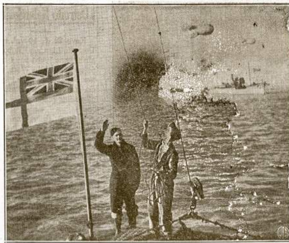
Ballonais apsaugo laivus Anglijos pakraščiuose. Įsivėjęs į tokio baliono virves, kuriom jie pritvirtinti prie laivų, nacių orlaivis pasijauštų kaip musė vortinklyje. Daugelis tokių balionų nuolatos kabo viršuje Londono ir kitų didmiesčių Anglijoje.

Pelningas ir saugus investimas—perkant Jungtinių Valstijų Defense Bonds ir Stamps. Be to, tas užtikrins pergale prieš fašistinius barbarus.