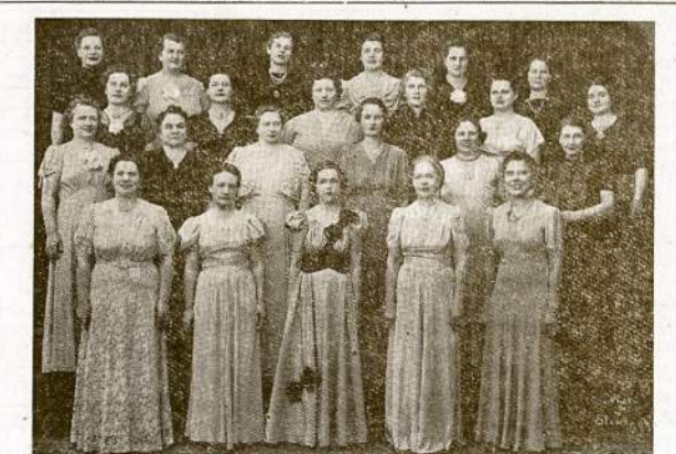
Chicagos Motery Kulturos Choras pildys dainu programą. Riešinis laikrodukas prie jzangos.