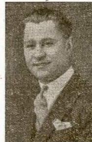
"Prime Minister" Victor Preiksa