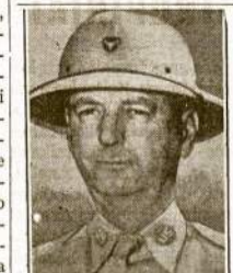
Majoras generolas Jonathan M. Wainwright, kuris dabar Filipinuose užima gen. MacArthuro vietą.

Taupinkite savo pinigus Dėdės Samo idžinėje ir padėkite sutruškinti hitlerizmui investuodami į Defensę Bondus ir Stampas.