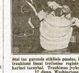
Štai tas garsusis stiklinis puodas, iš kurio buvo traukiami liosai trečiosios registracijos vyrų karinei tarnybai. Traukimas įvyko šio mėnesio 17 dieną, Washingtone.

"New Masses" galite gauti ir "Vilnius" ofise. Vieno numerio kaina tik 15 centų. Žurnalo adresas: New Masses, 461 Fourth Ave., New York City.