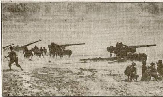
Amerikos kariuomenė išbando didžiulius šautuvus, vadinamus "mobile rifles." Jos šauja 100 svarų kulka ir neša 17 mylių.