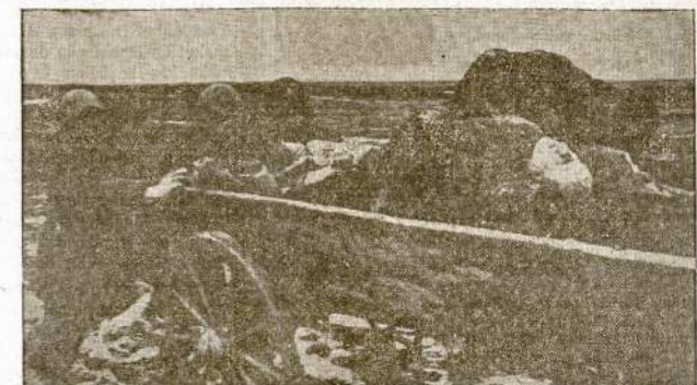
Kerč, Kryme, išlikusieji gyvi civiliniai gyventojai surenka ir veža savo giminių ir draugų lavonus palaidoti.