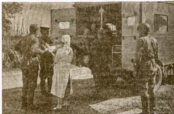
Sužeistą raudonarmietį deda į ambulansą nugabenimui į karo lauko ligoninę, kur jam suteikta pagelba.