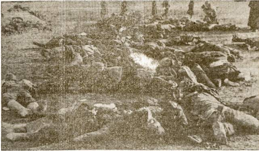
Lavonai žmonių, kuriuos naciški kanibalai sušaudė garsiojo miesto Rostovo proletariniam distrikte.