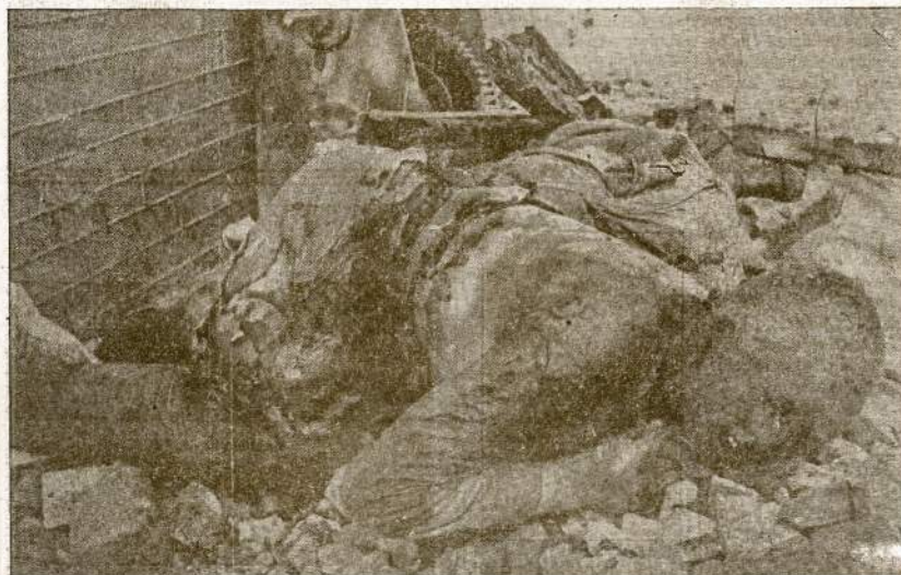
1941 metų liepos viduryje fašistų armijos vienetas užpuolė miestelį N. ir įsiveržė. Paskui Raudonoji Armija juos iš ten išmušė. Paveikslas parodo nacių barbarų paliktus pėdsakus. Tai lavonai Raudonosios Armijos komandierių, kuriuos suimtus naciai degino po baisaus kankinimo.