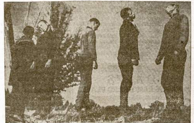
Tas pats vaizdas nutrauktas iš arti.