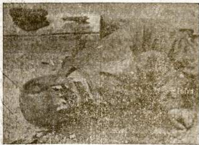
Geležinkelietis, auka nacių sprogtančiosios (Dum-Dum) kulkos.