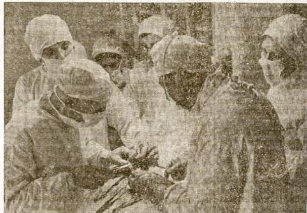
Gdytojai ir slaugės karo lauko ligoninėje daro operaciją.