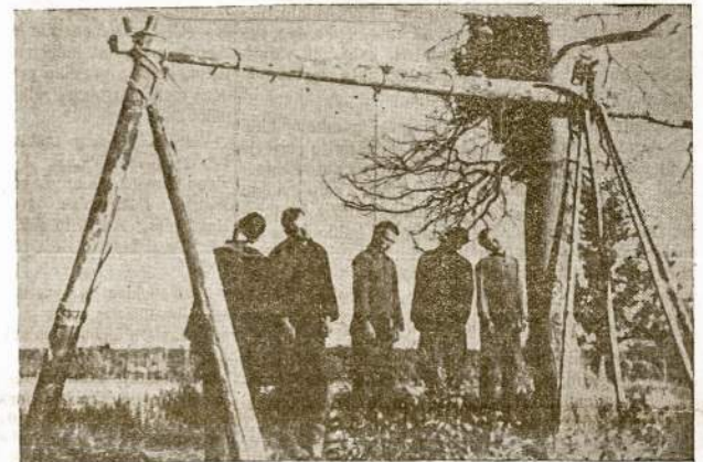
Barbarų palikti penki pakartieji, idant išgąsdintus civilinius žmones.