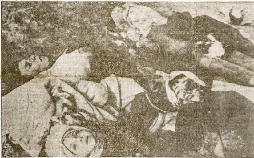
Naciai nužudė tūkstančius civilinių žmonių — vyrų, moterų ir vaikų — mieste Kerč, Kryme. Šis paveikslas parodo tos skerdynės krūvą lavonų.