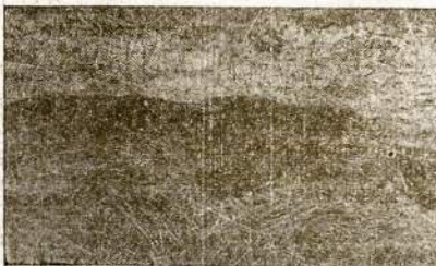
Tiktai liekanos raudonarmiečio, kurį prie kaimo Kuzmino ir Miakischevo naciai gyvą sudegino. Paskui Raudonoji Armija naciaus iš tos vietos išgrūdo ir vietiniai gyventojai papasakojo apie šitą nacių barbarizmą.