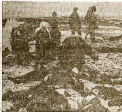
Kerčė, Kryme, giminės įiesko tarpe lavonų savo mylimųjų.