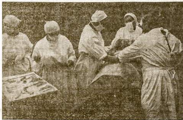
Sovietų karo lauko ligoninė.