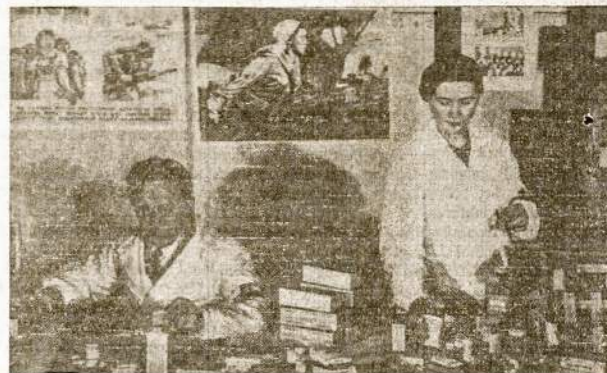
Daktaras ir slaugė tvarko dovanas, gautas iš Amerikos ir Argentinos raudonarmiečiams ir žmonėms tų distriktų, iš kur naciški barbarai tapo išgrūsti.