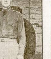
Paul Mellon, buvusiojo iždinės ministerio sūnus, jau antro rango leitenantas. Jis virs metus išstarnavo eiliniu kareiviu, o dabar mokina naujokus kavalerijos dalinyje Fort Riley, Kan.

Bet nereikia to laukti. Mūsų svarbiausias uždavinys dabar kovoti prieš hitlerinį elementą, prieš naciams talkininkaujancį spaudą. Vykime ją iš lietuvių namų. Profesionalas.