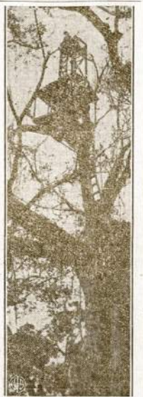
Amerikiečių patuliuoimo bokštas Olandijos kolonijoj Gujanaoje, Pietų Amerikoj. Kad nedalstyt naciams užimti tą turtingą mineralais ir metalais kolonija, apie metai laiko atgal ten pasijsta mūsų kariuomenės daliniai.

Taip jau ketvirtas ar penktas fašistinis laikraštis uždarytas. Jei lietuvių fašistiniai juodlapijai gali vesti savo hitlerinę propagandą, tai gal dėlto, kad jie skaitomi menkučiais, mažiau kenkiančiais, o tuo tarpu stengiamasi suraminti didesnius, labiau pavojingus. Nesistebėsimė tačiau, jei ateis ir jų kaina.