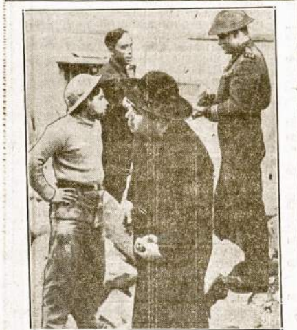
Prie karo ligininės Malta saloje. Anglikonų dvasiškis atlikimui religinių pareigų-kačių liginonė atneštam sužeistam kareiviui. Malta sala jau virš 2 metai kaip veik be perstojo nacių ir italų fašistų bombarduojama iš oro.