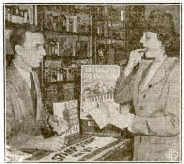
Virš 60,000 vaistinių Amerikoje jau kelinta savaitė pasiūlo kostumeriams vietoj gražos pinigais paimti karinėm taupym stampom. Šiame atvaizde aktorka Katherine Cornell lipina kvoterinę stampą į savo albumą vienoj New Yorko vaistinėj.

(Tąsa nuo pusl. 3) dangstytose žvėryų kailiais, o žiemą lindėdamas urvuose. Graikų ir romėnų rašytojai paliko mums žinias, jog urvai yra buvę pirmų pirmosios žmogaus gyvenamos vietos. Padavimai sako, jog urvuose gyveno ne tik paprastai žmonės, bet ir legendiniai milžinai, burtininkai, žavėtojai, raganos ir kitos "požeminės nuostabios galybės." Norint sužinoti daugiau