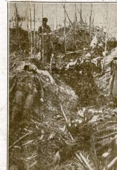
Vokiečiai ištaškyta transeja rytu fronte. Raudonarmiečiai transejoje randa daugybę vokiečių lavonų. Išlikę gyvi pasidoda į nelaisvę.

NEW YORKAS.—Karo gamybos bordo pirmininkas Donald M. Nelson pareiškė, kad nuo dabar kiekvienas fabrikas, kiekviena įmonė, kasykla ir žemės ūkis gamins vien tik karo reikmenis. Šia proga Nelsonas pastebėjo, kad kartais gali prikriti kai kurių labai reikalingų žaliavų.