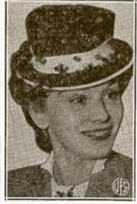
Vengraitė Eva Gabor, kuri keli metai atgal atvyko į Jungt. Valstijas ir puseitaini pasižymėjo judžiose. Ji šiom dienom patapo Amerikos pilietė su tikslu čia apsigyventi ant visados.