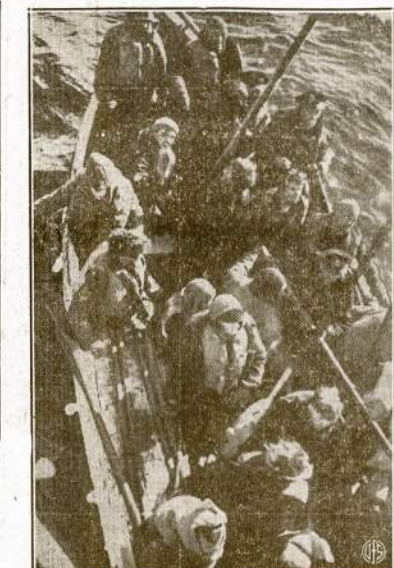
Šioj valtyj šitie anglai jūreiviai išbuvo šaltam ir audringam Atlante 36 valandas, kai jų prekybinį laivą nuskandino nacių submarinas. Paskui juos išgelbėjo Anglijos krantų sargybos laivas.

Pasivaktuodamas kruizeris pakraščiais slinko į Vokietijos jūrą nors uostą remontui. Su dviem kovos laivais kruizeris bėgdamas per anglų blokadą Dover sąsmaukoj įrgi buvo geroai sužeistas. Dabar ta žaizda bus padidinta.