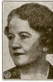
Ellen Glasgow, amerikietė novelistė, katik aplaikiusi Pulitzer dovaną už jos parašytą novelę "In This Our Life."