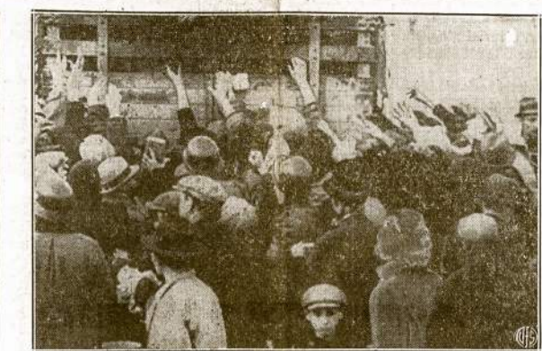
Francūzai stovi eilėje, kad gauti riekelę duonos ir dubinėlių sriubos. Tai štai ko Prancūzijos žmonės susilaukė, kad 1940 metais pasidavė vokiečiams.

(Stockholmo šaltiniai skelbia, būk Charkovo fronte Sovietų tūri šėsis pulkus prieš vieną nacių. Sovietai esą naudoja artileriją 8,2 colių ir įsiveržėlius puola atvėjais).