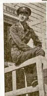
"Redwings" Kuopos Narys A. Sweyrush Gina Demokratiją Anapus Pacifiko.

"Aš rašau jums visiems kartu, mes... well, taip yra patogu. Aš seku jūsų veikimą, draugai, ir man būtų labai malonu, jei jūs galėtumet man parašyti eilutę ar kitą... Aš tada būčiau geriau informuotas apie viską, kas dedasi pas jus.