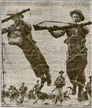
Čia dar tik pratimai, bet ir aktualiam mūšyje šie vyrai metasi patys pirmieji į priešų pusę ir versdamiesi per spygliuotų vielų užtvanas nulenkia jas palengvinimui kitiems kareiviams žygiuoti pirmyn. Paveikslas nutrauktas laike manevrų kurnors Australijoje.