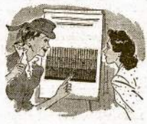
Miss Scott: Ši trečioji rūšis daugiausia gadinama tamtos kaurą... giliai įbedusi į audinio žvėgdūtuotais atšalia kraštais piauštyti suplausto siūlus. Ši rūšis dulkų tegali būti įvalyta iš kauru tik naudojant moderniška elektrikinį valytuvą su galinga siurbimo jėga.

Miss Scott: Tikrai taip ir yra. Čia taipgi parodo tris skirtingas dulkų rūšis, kurios randasi kauruose. Pirmosios dvi, kurios mažai ką kenkia kaurui, duodasi lengvai išvalomos su paprastu valytuvu arba šluota.