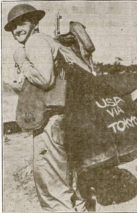
TRAVELING MAN —Before this American soldier, arriving at an unnamed camp in Australia, gets through with this war, he wants to see some of the world, so he's chalked his itinerary on his barracks bag. Uncle Sam recently sent bombers over Tokio to soften city for American reception.