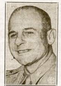
Brig. gen. James Doolittle, kuris vadovavo skadrontui amerikiečių lakūnų bombardavime Japonijos sostinės Tokio ir kelių kitų didmiesčių.

Anot tos patarlės: Miske augęs, į miską ir žiūrė.