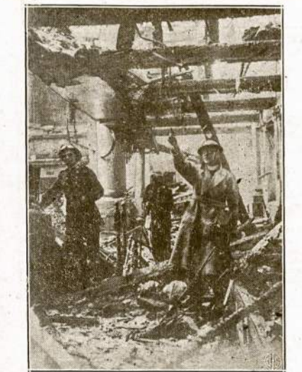
Keršydami anglams už subombardavimą amunicijos fabriku Vokietijoje, naciai aną dieną užpuolė ir sunaikino rezortinį miestą Bath. Šiame atvaizde matytis kunigas ir keli parapijonai apžiūri bažnyčios griuvėsius.