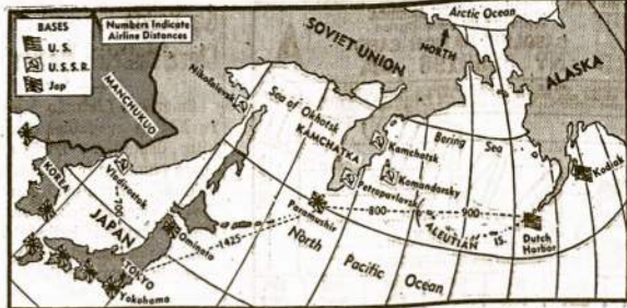
Mūsų šiaurinės kolonijos Alaskos žemėlapis. Dešinėje, netoli apacios, matosi Dutch Harbor, kurį aną dieną japonai dvim atvejais bombardavo iš oro. Nuostolių padaryta mažai. Dutch Harbor randasi ant Unalaska salos, Aleutian salyno grupėje.