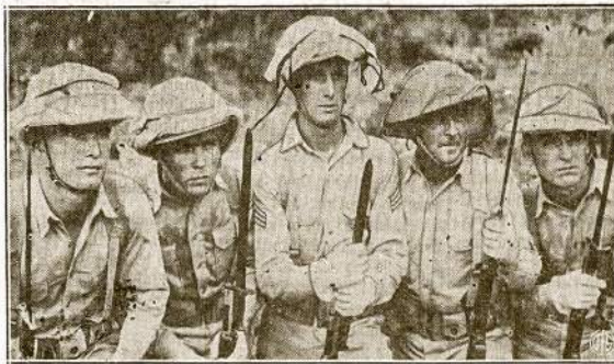
Vienas didžiausių nesmagųjų mūsų kariuomenės daliniamis tropiškose kraštuose yra biaurieji uodai. Štai būrys mūsų kareivių kurnors Vakarų Indijos salyne. Išvengimui uodų įjyimo, kas neretai apkrečia įvairiom ligom, kareiviai dėvi tam tikslui pritaikytas uniformas ir nešioja veidų uždangalus.

Tikrenybėje betgi yra tokie, kuriems ištikrųjų ap-