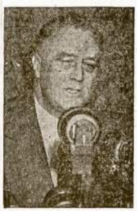
PREZ. ROOSEVELTAS Jis turėjo visą eilę diplomatinių vizitorijų. Sakoma, jog tai reikš kins pasirošimo antram frontui Europoj.