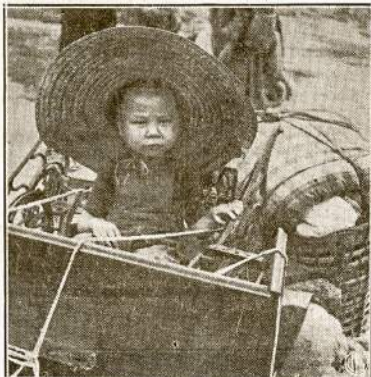
Kuom ir kam yra prasikaltęs šis mazytis Kinijos pilietis, kad jo namai turėjo būti sunaikinti, artimieji saviškiai nužudyti? Tai valdželis iš Chengtu, vakarinės Kinijos. Japonai tą miestą jau senas laikas bombarduoja iš oro kasdiena. Ir jie pasidūrė tokie punktuolikai, kas kas rytas atskrenda kaip 11 valanda.

Keturį japonų orlaiviai numusta kitose atakose. Japonų orlaiviai atėkė nuo Naujos Gvinejos salų.