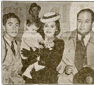
Buvęs Meksikos militarinis atašė Berlyne ir šeima grįžta namo. Jie iš Europos parvyko kartu su Amerikos diplomatais ir laikraštiniškais švedų laivu "Drotningholm" mainais už nacinius ir italiskus diplomatus.

LLD 51 kp.: Kuopa turi 23 narius. Už šiuos metus užsimekėję 15. Įvairiems reikalams išaukauta: "Vilnies" presui $3; moterų žurnalui $3; Sovietų medikalei pagelbai $25 ir nariai sudė-