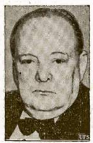
WINSTON CHURCHILL Britanijos premieras, atvykęs į Washington pasitarimui. Jo misija, sakoma, yra ryšium su antrą fronto atidarymu.

MONTEVIDEO.—Urugvajaus gelžkeliu magnatai nori uždaryti Gelžkelio Darbininkų Federaciją, atstatinėja jos vadus iš darbo. Tuo jų žygiu dideliai piktinasi žmonės.