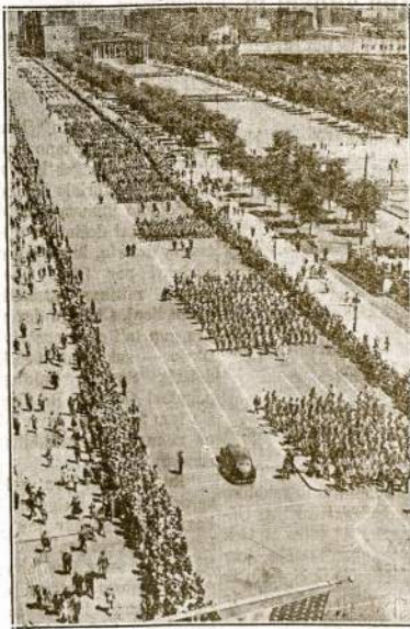
Michigan bulvaras laike milioninio parado birželio 14 dieną. Paradas tęsiasi virš 15 valandų.