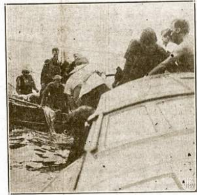
Jungtinių Valstijų laivas paima 7 Panamos prekybinio laivo jūrininkus kur nors Karibėjų jūroje. Išgelbėti jūrininkai plūduriavo jūroje mažame gelbėjimosi laivelyje septynis dienas ir naktis pirma juos pastebėjo vienas mūsų orlaivių bepartuliuojančių Vakarų Indijos salas.

CHUNGKING.—Kinijos karinė aukštoji komanda praneša, kad geležinkelio stotis Kwei-ki pateko į priešų rankas.