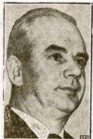
MURRAY CIO Unijų Galva

Tautos laisvė, tautos garbė ir jos kultūros apgynimas šaukia mus prie didesnės vienybės, prie masinio dalyvavimo ateinantį sekmadienį milžiniškame protesto mitinge.