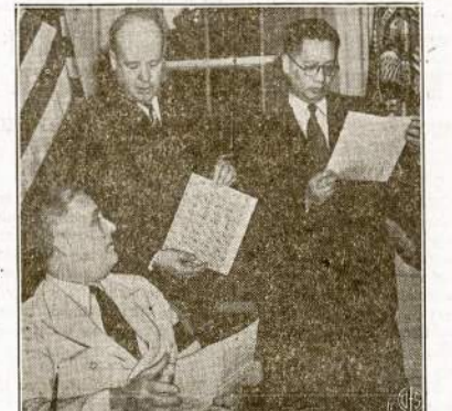
Prezidentas Rooseveltas ir Dr. T. V. Soong, Kinijos užsienio reikalų ministras, perka pačius pirmutinius krasaženklius 5 centų, kurie išleista pamėnėjimui penkių metų Kinijos karū sukakties. Jiems parduoda krasaženklius generalis postmasteris Frank Walker. (Walker kalbės Chicagoj liepos 19, Slavy parade Zalgirio mūšio minėjimui.)