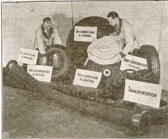
Paveiksle matome kur dabar daugiausia eina gumas. Jis naudojamas labiausia reikalingiems dalykams ryšium su karu. Paveikslas nuimtas Goodrich kompanijos išsiuntimo (shipping) sandėlyje.

Laisvės už pinigus nenupirskite. Bet jūsų doleriai, investuoti į valdžios Defense Bonds ir Stamps prigrėitins galą ašies barbarams.