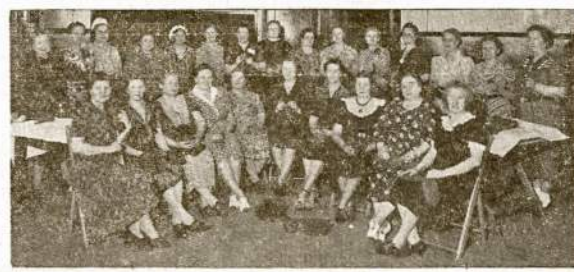
Chicago Lietuvių Mezgėjų Grupė susitvėrusi gruodžio 4, 1941, ir per vasaros karščius jos darbo nenutraukia. Žiemos sezonui rengiasi dar daugiau veikti, kol Pergalė bus laimėta.

Kada stuba įkaista ir nežina kur dėtis, kad bent kiek apsiginti nuo karščio, pamėgink sekama skymą: maudynė prileisk pilną šalto vandens. Tas vanduo sutrauks karštį netik maudynės kambario, bet dalinai ir antro kambario. Virtuvėje taipgi prileisk didelį blūdą šalto vandens, prie to dar paimek kelis storus abrusus arba paklodę ir pamirkinus šaltam vandeny, pakabink. Už valandos vėl atkartok. Anksti ryte uždarinėk langus ir užleisk uždangalus, ypač tuo pusėj stubos, kurią saulė liečia per pietus ir po pietų. Monika.