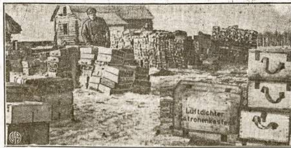
Štai tik viena krūva nacių ginklų ir amunicijos, kurių jie nespėjo pasiimti traukdamiesi atgal viename Sovietų fronte, kur nors Leningrado srityje.

Man atrodo, kad visur galėjo būti kaltės, tik vienur gal daugiau, kitur mažiau. Bet tai nėra gerai. Mes nesame pripratę matyti savo organizaciją sumažintą kad ir vienu nariu!