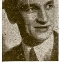
JUSTAS PALECKIS Lietuvos T. S. R. Aukščiausios Tarybos Prezidentas.