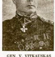
GEN. V. VITKAUSKAS Savo liaudžių ištikimas karys, Lietuvos T. S. R. Aukščiausios Tarybos Prezidentas.