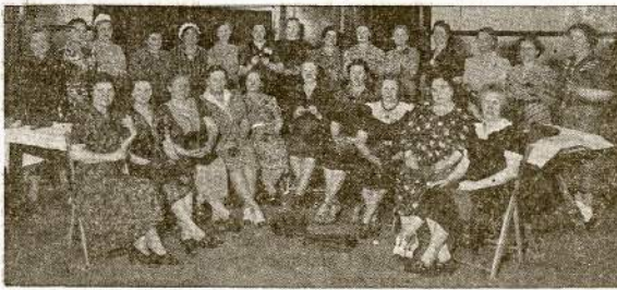
Chicago mezgėjų grupė. Jos daug kojinių ir svederį numezgė dėl Rusų Karo Pagelbos. Šį sekmadienį, liepos 26 d., mezgejos rengia pikniką ir pietus Buffalo Parke, 87th ir Kean ave. Pradžią 12 v. dienos. Gera muzika šokiam.