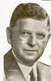
Mayor Edward J. Kelly