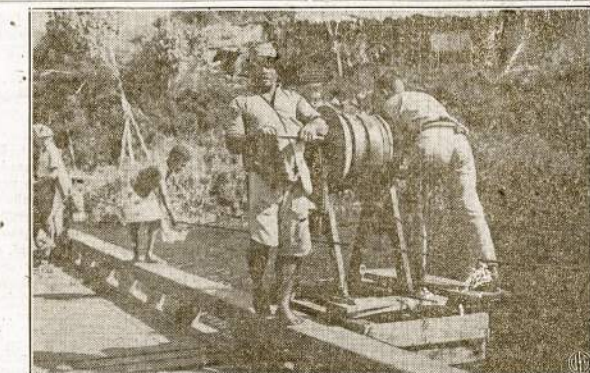
Amerikos kareiviai New Caledonia saloj suka karta, kuris traukia primityvų pervažą per upę. Čia naujoviniai per upes persikėlimo būdai kaip ir nežinomi, bent nuolatosioje nuo miestų srityse. Kai kur Pacifiko salose, ypač Borneo, yra didelio kontrasto—miestai moderniški, o kiek toliau nuo jų visai primityvi gyvenimas.