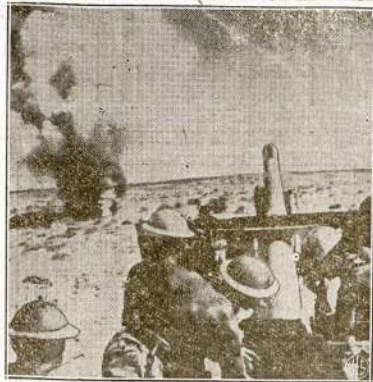
Anglijos kareiviai atsišauko naciams smarkioj atakoj prie Mersa Matruh, Egipte kai Ašes armija ėmė stumti anglius iš Libijos.

Ne miestų triobos, ne malūnai ir kiti pastatai sudaro šalį-valstybę. Žmonės tad