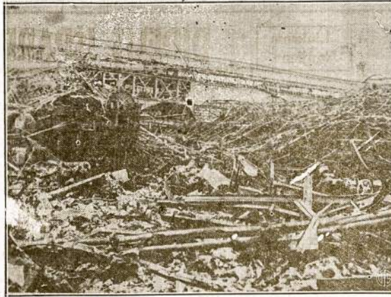
Štai kas beliko iš didžiojo amunicijos fabriko Paryžiaus priemiestyje, kada anglų bombonešiai jį išsprogdino kovo 3 dieną. Naciai bandė įtikinti svietą, kad anglai pataikė tik "į rezidencinę sekciją." Šis atvaizdas išgąbentas iš okupuotos Francūzijos visai ką kitą rodo.

NEW DELHI, liepos 31. — Gandhi artimi draugai pareiškė, kad indusai prielankiai susitūti Amerikos išsimašymą į jų konfliktą su britais. Tie patys asmenys pabrėžė, kad indusai nacionalistai vien tada rimtai imtų domėn Amerikos pasiūlymus, jei jie atneštų kokius konkrečius projektus.