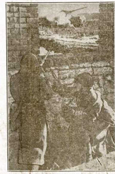
Raudonarmiečiai taikliniai šūviu sušaukė nacinį tanką. Paskutiniai pranešimai iš fronto sako, kad nacių veržimasis sulėtintas, bet pavojinga padėtis dar nepaitecia.

ANKARA. — Per paskutines 45 dienas Jungtinės Valstybės pasuntė Turkijai apie 15,000 tonų kviečių. Apie tai pranešamas ministeris pirmininkas Sukru Sarakoglu pareiškė, kad Jungtinės Valstybės yra pasiūlymus pristatyti Turkijai visus reikalingus kviečius, jei turkai galėtų pristatyti transportacijos priemones.