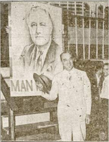
Senatorius James M. Mead, kandidatas į New Yorko valstijos gubernatorių, pradėda savo kampaniją. Prezidentas Rooseveltas remia Mead, bet jam priešingas James Farley, kuris berods pats nori kandidatuoti. Meadą remia Darbo Partija ir darbo unijos. Jis turi gerą progą būti išrinktas gubernatorium.

Kai tvėrėsi Lietuvos valstybė—viskas kitaip vorto. Bizniai sušvito ir prasčiokams vertėioms ir inteligentams. Visi už vienas kitu ruošėsi lobti be galo; bet visi rūpinosi įsteigt aparatą to biznio ir nuosavybės apsaugai. Tas aparatas vadinosi valstybe. Sena, demokratiškoji aušrininkų apšvieta numesta į purvyną. Pati demokratybė sumindžiota, giliai įtrempta į tą patį purvyną. Lobimas iš žmonių darbo spėkų—vietojo jų apšvietos. Lietuvos valstybė su neribo-