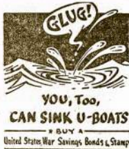
United States War Savings Bonds & Stamps

MASKVA, rugp. 7.—"Laisvosios Jugoslavijos" radio stotis, kuri randasi kur nors partizanų laikomoje teritorijoje, praneša kad partizanų aviacijos jėgos bombardavo priešo kareivines Banja Luka srityje. Jau anksčiau buvo pranešta, kad partizanai naudoja lėktuvus. Dabar sužinota, kad visa eilė kroatų lakūnų kartu su savo lėktuvais perėjo pas partizanus.