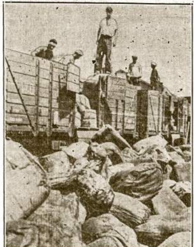
Kurnors ant Kaspijos jūros kranto, SSSR. Čia matosi iškraunamas laivas, kuris kažtik pribuvo su karine medžiaga gal iš Anglijos, o gal iš Amerikos.