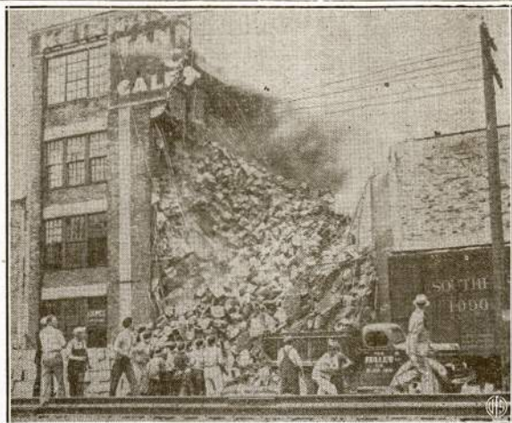
Griuvėsiai bravornės sandėlio, Milwaukee priemiestyje W a u w a tosa, Wis. Čia žuvo 11 darbininkų ir apie 15 tapo sunkiai ar lengviau sužeista. Nelaimė įvyko pradendant atremontuoti būdnką.