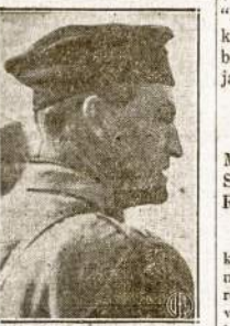
Brigadierius generolas C. L. Chennault. Jis komanduoja mūsų karinius lakūnus Kinijoje.

Laivyno pareigūnai praneša, kad nacių submarinų skaičius mūsų rytiniame pakraštyje darosi vis mažėsnis. Naciai savo veikimo centrą dabar perkėlia į pietinį Atlantų ir arciau Anglijos. Jie tai daro ne iš gero noro, aišku, bet vien mūsų sąstiprinto apsaugos priemonių veigiami.