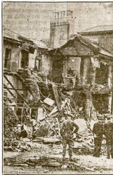
Pats žūdamas dar ir kitiems žalos padarė. Štai kas atsitiko aną dieną tūlam kaime Anglijoje. Anglų anti-orlaivinės kanuolės pasovė nacių bomberį, kuris kridamas žemyn pataikė į stubą. Kaip matyti šiame paveiksle, stubą gerokai apgriovė, bet žmonių neužmusė. Žuvo tik nacių laukūnai ir jų bombieris.