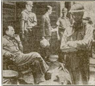
Majoras generolas Jonathan M. Wainwright (dešinėje) su plieniniu šalmu, kurį japonai suėmė ir nelaisvė Filipinų salose. Jis čia su keliais kitais amerikiečiais belaisviais kur nors Japonijos koncentracijos stovykloje.

Prie Emergency Public Works Service yra "Demolition and Clearance and Road Repair" grupės, ir jų užduotis yra laikyti vieškelius atdarus, gatves nuvalytas, įgrivimus prašalintus, ir tt. Jeigu nelaimė kirs Ameri-