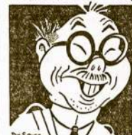
Dr. Seuss WARSAVINGS BONDS & STAMPS