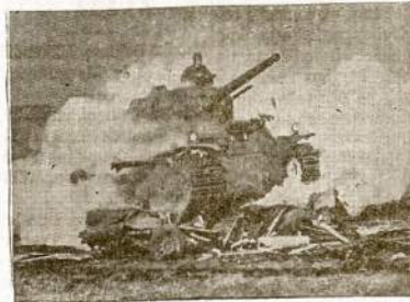
Vienas tankų, kuriuos matysite armijos parodyme. Įžanga 55c. Pradžią 8 val. vakaro.