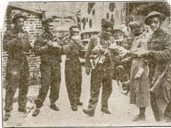
Būrys kanadiečių "Commandos" kėtik sugrįžė iš nacių okupuoto Prancūzijos miesto Dieppe. Kaip matyti, jie išsidirbė neblogo apetitą ir mielai priima angtų šeiminių svetingumą.

Galite įsivaizduoti kaip pakitėjęs Hollywoodas atsinešimū į SSSR. Ne veltui mano pažystamas susirūpi-