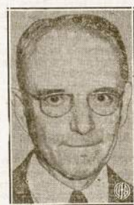
William D. Mitchell, specialus federalės valdžios prokuroras. Jis šiom dienom tyrinėjo kaltinimus prieš Chicago "Tribune."

Bet kiek pas juos ambicijų "vadovauti tautai!"