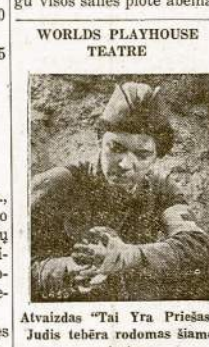
Atvaizdas "Tai Yra Priešas, Judis tebėra rodomas šiame teatre.