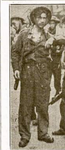
Būrys aliantų Komandos, kurie aną dieną buvo siveržė į Dieppe, Francizijoje. Atakoje dalyvaavo kanadiečių, anglių, laisvųjų francūzių ir amerikiečių Rangers būriai. Šis paveikslas prisistatys iš Anglijos per radiją kada Komandos buvo tik grynė iš atakos.