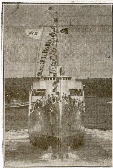
Naujutėlis Amerikos karinis laivas "U. S. S. Conway", kuris kartu su kitu sarvnotlaiviu "Conway" tik kelios dienos nuleistis į vandenį. Ta pačia diena užbaigti budavoti dar 6 dideli prekiniai laivai.

Italai sako, jog ir Egipte naciai nunušę 3 britų orlaivius.