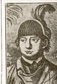
Senas portretas kapitono Robert Rogers, kuris pirmasis suorganizavo Ranglers Amerikoje, kada čia ėjo kovos su indjonais. Dabar tuo vardu pasivadina mūsų narsieji kareiviai, kurie jau karą buvo įsiveržę į nacijų okupuotą Prancūziją.

Keturi britų submarinai atakavo Italijos konvojų ir du laivus nuskindino.