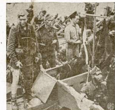
Dar vienas vaizdelis grūžusių iš Dieppe karių. Tas bandymas įsiveržimas jau pradėdamas pamiršti, ir laisvais pasaulis jaučia, kad jis vien bandymais karo nelaimės. Nekantirai britai, amerikiečiai ir mūsų kovojantieji sąjungininkai Sovietų Sąjungoje laukia to įsiveržimo pakartojimo, didesnio, galingsnio, vienu kartu daugelyje punktų—vakarinio fronto kontinente atidarymo.

LONDONAS.—Romos radio sako, kad britų daliniai bandė išlipti Cerigotto saloje. Minima sala randasi 50 mylių atstumu nuo Kretos, į šiaurvakarius.