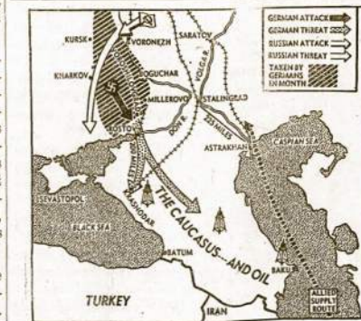
Štai tas žemės rutulio kampas, kuriame šiom laikų eina didžiausi pasaulio istorijoje mūšiai tarpe susivienijusių hitlerinės ašies jėgų ir Raudonosios Armijos. Jei Sąjungininkai atidarytų antrą frontą vakaruose, Hitleris būtų priverstas ištraukti dalį savo gajų iš Pavolgio ir Kaukazo. Tada banditai būtų daug greičiau apgalėti.