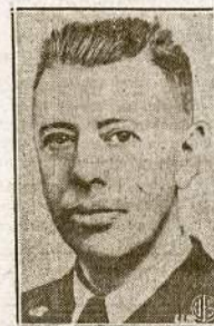
Majoras generolas G. C. Kenney, kuris nesėnai gen. MacArthur'o paskirtas vyriausiu komandierium oriano laivyno pietvakariniam Pacifike