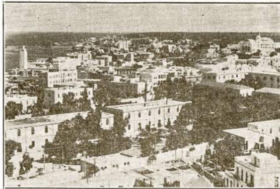
Tripolis, pats svarbus Libijos miestas ir prieplauka. Amerikos kariuomenė, kartu su britais, artinasi link šio miesto ir tikimasi netrukus iš ten nacių ir italų jėgas bus išmūšę. Amerikiečiams žygis į Tripolį jau bus antras. 1815 metais amerikiečių kariuomenė, vadovybėje Stephen Decatur, buvo užėmusi Tripolį ir apvalė jį aplieinkę nuo banditų, kurie puldinėjo prekybinius laivus Viduržemio jareje.

Arabų kalbose amerikiečiai buvo prisirengę. Tikrai vieną dialektą, morokų, nebuvo išmoko, bet dabar Pennsylvania Universitetas