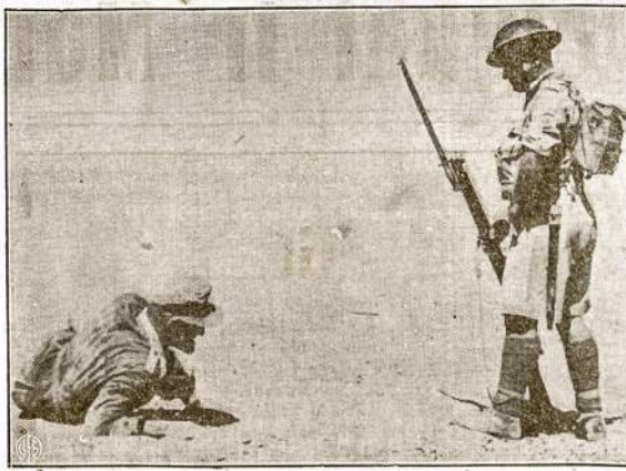
Načių generolas Rommel ir jo gaujos taip greitai bėga Afrikos tyruose nuo Susivienintųjų Tautų Jėgų, kad negali su savim paminti sužeistus ir karštieji bei troškulo pritrėktus savo draugus. Štai anglas kareivis žiūri į begulintį karštamę smėlyje načių karininką. Jis laukia iki atvažiuos ligonvežimis paminti sužeistą načių.

Pašto departamentas praneša, kad yra davinių, jog šiais metais Kalėdų siuntinių skaičius bus rekordinis. Pirkimai krautuose rugsėjo mėnesį—paskutinis mėnuo, del kurio paduodama skaičiai—buvo šiais metais