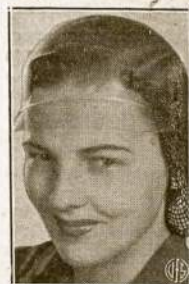
Miss Lilly Dache demonstruoja naujai išrastą galvos apdangalą, kuris merginoms dirbant karinėje industrijose palaiko tvarkoje plaukus ir tuom pačiu skykia yra permotomas, nepaslepiama naujai įsigytą "permanent wave."

numetant nei jų lapų, kaip tai: ropių, morkų, burokų ir kitų daržovių, kurių yra daugybė markete.