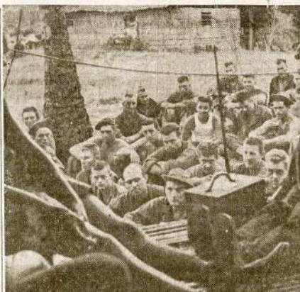
Būrys amerikiečių kareivių ir marijų klausosi žinių iš namų fronto per radiją karnors Naujosios Gvinejos raistuose. Paiveiklas nutrauktas prieš pat išvejanč japonus iš Buna srities.

Mokyklų viršininkai padės pravesti rinkliavą. Daugiausia nuo šios ligos nukentė vaikai. Todėl labai svarbu ir jiems įsitraukti į rinkliavą dėl kovos prieš vaikų paralyžių.