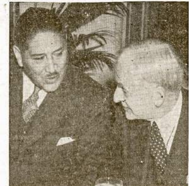
Generolas Enrique Penaranda, prezidentas Bolivia respublikos. Jis šiom dienom lankėsi Washingtono ir šiame atvaizde matomas besikalbant su mūsų valstybės sekretorium Cordell Hull.