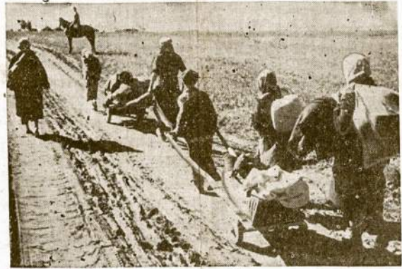
Sovietų Sąjungos valstiečiai gryžta į savo gimtinį Žubovą, kur jie vietoj namų ras tik griuvėsius. Gryžta jie su mažai mantos, bet pasiryžę atbudavoti savo namus ir miestą.