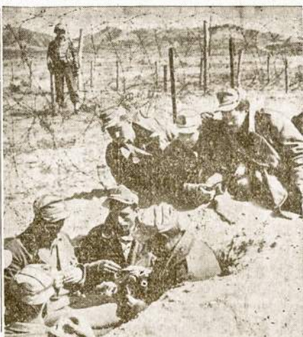
Šis būrys italų juodmaršinių nelabai nuliūdė, kai amerikiečiai juos paėmė nelaisvėn Tunisioje. Jie bent pavalgiti gaus riekalai ir bus laikomi toli nuo mūsų fronto per visą karą.

Atsimenate, kaip Hitlerio propagandos mašina Berlyne paskelbė, būk Sovietai prie Smolensko sausūdė 18,000 lenkų oficerių?