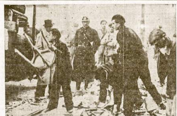
Slaptai iš Paryžiaus išgabenta fotografija parodo francūzus darbininkus apvalant griuvėsius Renault amunicijos fabriko aplinkėje, kada jų išbombardavo aliantų bombonašai. Kuomet francūzai darbuojasi, tai užpakalyje jų stovi ginkluotas nacių policistas.