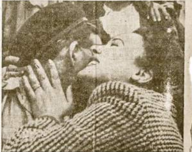
Po dviejų metų nacių okupacijos ši Tuniso moteris išreikiška visą krašto gyventojų jausmą, kada britų ir amerikiečių jėgos išvyjo iš ten asies barbarus. Ji apsilankiusi nepažįstama anglų tankistų sveikina kaip artimiausią giminingai.

Stai dėlko mes keršijame vokiečiams, ir keršysime iki įsiveržėliai—bus išmūsti iš mūsų žemės ir Lietuvos Tarybinė Socialistinė Respublika vėl gyvuos.