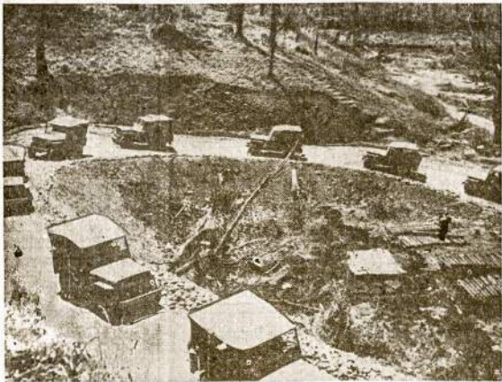
Allantų trokų karavanas kurnors Burmos apielinkėje. Japonams užėmus Burmą ir garsųj Burmos vieškelį, anglų ir amerikičių inžinieriai į 6 mėnesius išbudavojo kitą vieškelį, kuriom vientise linija trokais pristatoma karo reikmenys Tolimųjų Rytų frontan.

Gerai, kad tuom sykiu traukiny sustojo ir mane konduktorius išvarė lauk. Kitaip būčiau ta velniukštį pasmauges. Įsivaizdinkite, mano liurbinamai "Naujiečių" skaitytajai: Jei Bimba sužinotų, kad 11 metų vaikas mane į beigėlį surietė, tai kur tada akis kiščiau? Mokyčiausias ir už mokintus, Herr Doktor Grigapijait.