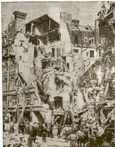
Civilinio apsigynimo pareigūnai ieško lauvų apartamentinio namo griuvėsiuose, kurnors rytiniame krašte Anglijos. Be šio namo sugriauta dar kelios kraituvės ir kino teatras. O načiai rėkia lyg kariami, kad angliai ir amerikiečiai "harbariškai" bombarduoja Vokietijos miestus!

I TAMSTA GERBIAMAS PRENUMERATORIAU! Visuotinio karo padėtis reikalauja iš kiekvieno didžiausio taupymo. Prenumeratai išsibaigus nebegalima stumti dienraštis ir laukti ar skaitytojas atsinaujinti. Dėlto nelankite atkarotinių pargintų, bet dar baigiantis terminu atnaujinkite prenumeratą. "V." Adm.