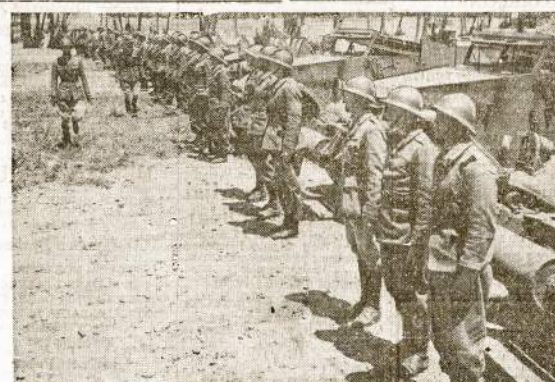
Amerikos karo reikmenys kiti prisiusti francūzams Afrikoje. Siuntinyje yra tankų, orlaivių, įvairaus kalibro kanonių ir daugybė šovinių. Laikinoji francūzų vyriausybė efermoniajai priima Amerikos dovaną, kurią jie tinkamai panaudos kovoje prieš fašistinius banditus.

Lietuviškas Žydūkas 3529 S. Halsted Street Phone Yards 6054