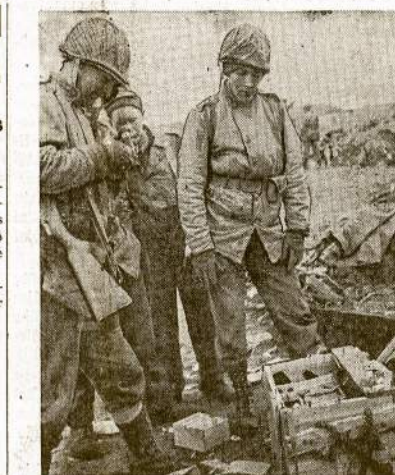
Amerikos kareiviai Attu saloj tiria japonų paliktas dėzes, kurios gali būti užtaisytos sprogimui. Jie žingėdauja, bet taipgi ir atsargiai atidarinėja. Japonai Attu saloj jau visai išrankioti.

MADRIDAS.—Grenoble, Francūzijoje, gūrsas sunaikinti didelius gumo sandėlius. Padegę gumo sandėlius francūzai patriotai.