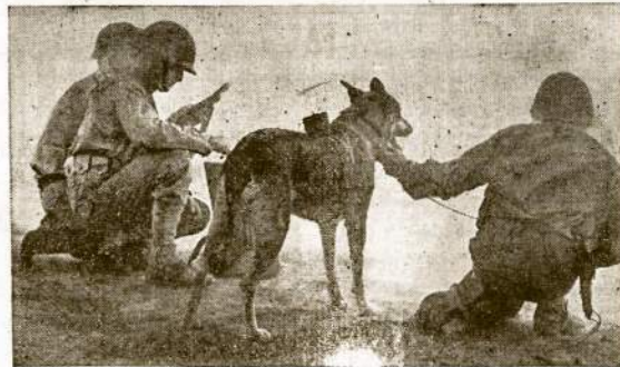
Šiame kare prieš asies barbarus ir šunes pad čia Sąjungininkam. Štai vienas jų apmokomas kaip nutiesti vielas telefonu susisiekti nuo pavojingos vietos. Mūsų armijos daliniai tokių išmokyti šunų jau turi desimtus tūkstančių. Jie atlieka įvairiausias pareigas ir daugeliu atvejų išgelbasi kareivio gyvybę.

LONDONAS, birž. 15.—Mirimai nuo džiovos Lenkijoj taip paplito, kad apgyvendinti volkčiai Lenkijoj atsidūrė pavojuje. Mirimai pasiekė 30 tuos. Bydosgės distrikte karų prasidėjus mirimai nuo džiovos padvigubėjo.