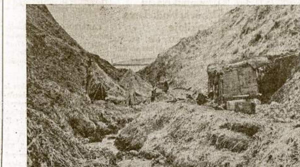
Šiaj oloj kalno atslaitėje japonai senenai ga mindavosį valgi, o dabar jų jau nei vieno čia nebėra. Tai japonų virtuvė Atsu saloj, kur jie senenai iki vienam išnaikinti.

Ve kodėl dabar laukimas nerūkalingas ir jis naudos tedeučių tik naciam.