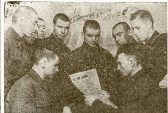
Būrys lietuvių raudonarmiečių liuoslaikio valandėlėje praleidžia laiką skaitydami lietuviškus laikraščius. Tokių kaip šie lietuviai Raudonojoje Armijoje yra gal virš 50,000. Šiandien sukanka 2 metai, kaip jie kovoja už savo tėvynės išlaisvinimą iš amžinyjų Lietuvos priešų Vokietijos nacų.

Šiandien, po dviejų metų kančių, ašarų ir priespaudos, Lietuvai kaip ir kitom Hitlerio pavergtom šalim laisvės spindulys pradeda vis aiškiau šviesti. Tai ne-reiškia, kad kova baigta ir jau mes šioj šaly galime ramiai rankas susidėję laukti karo užbaigos tik dėlto, kad Susijungusiom Tautom sekasi mušti priešą, tik dėlto, kad heroiška Raudonoji Ar-mija pasekmingai plekia Hitlerio armijas. Bet nusi-