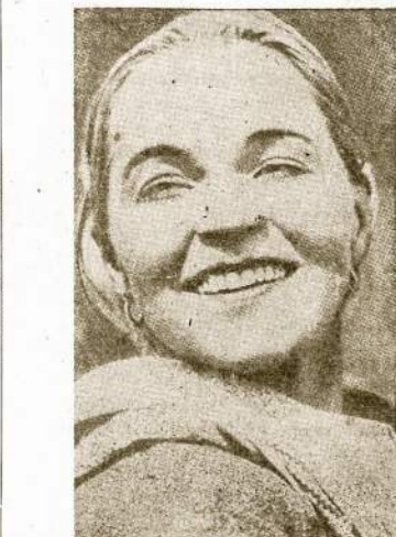
SALOMEJA NĖRIS, žymioji poetė ir Tarybų Lietuvos seimo narė. Jos eilėraš-čiai dažnai puošia mūsų Moterų Sky-riaus puslapį.