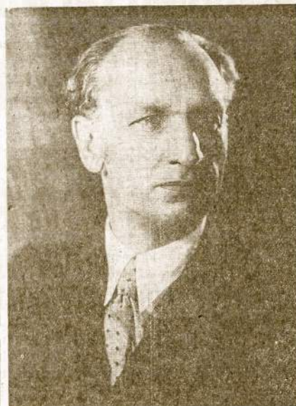
JUSTAS PALECKIS, Tarybų Lietuvos Aukščiausios Tarybos pirmininkas. Šiuom laiku jis gyvena Maskvoje ir tiesa dvejį metai atgal pradėtą kovą už Lietuvos ir viso pasaulio laisvę.

Negana to, Sovietų Sąjungą, o kartu ir Tarybinę Lietuvą (jos vadus) vadino banditais ir statė lygiais su nacinais plėšikais. Kai Jungtinių Valstijų prezidentas pažadėjo Sovietų Sąjungai paramą kare prieš nacius, tai "Naujienos" rašė "Stalinas lygus banditas Hitleriui." Ne paramą duotį ragino, bet atsisaukti į "Rusijos žmones, kad jie sukiltų ir nuverstų Stalino valdžią."