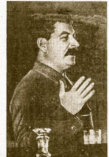
J. STALINAS, premieras ir vyriausiasis karinių jėgų komandantas visos SSSR, kuri jau du metai veda herošką karą prieš galingą Ašies armiją. Amerika šiandien rieškia pagerimą savo sąjungininkei Sovietų Sąjungai eile mitingų "TRIBUTE TO RUSSIA." Chicagoj tokis mitingas bus didžiuliamė Stadiume.