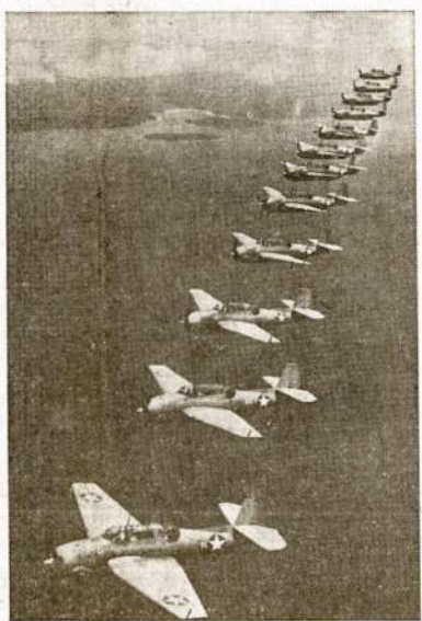
Dvylika Amerikos torpedinių bomberių skraido kur nors Pacifike ieškodami Japonijos laivų ir submarinų. Gražiai jie atrodo, bet užtiktas jų priesio laivas nesigėretų jais. Jie neša mirtį priesio laivams.