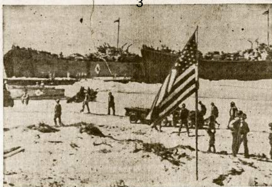
Žvaigždėtoji Jungtinių Valstijų vėliava jau plėvėsuoja ant Italijos žemės. Šis atvaizdas per radiją prisūstas amerikiečiam karšiam katič išlipus į Siciliiją. Dabar Aliantų jėgos jau baigia užimti visą salą, išskyrus tik žiemrytinį jos kraštą.

WASHINGTONAS, Ip. 25.—Amerikos kareiviai netik kaltauja prieš Ašį, savo jėgomis įveda demokratiją, bet jie teikia šalybei paskolę iš savo algos. Tai vienas penktadienis kareivų algų eina pirminko karos šūp. Jie tai daro iluosn- taip ir civiliai žmonės.