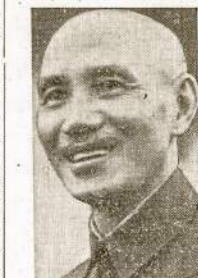
Vėliausia fotografija Kinijos generalissimo Chiang Kai-sheko. Jis čia netrodė per daug nusiimęs, nors jo šalis veda atkaklų karą prieš japonus jau septynis metus.

WASHINGTON. — Nuo 7 d. gruodžio 1941 metų Amerikos Laivyno nuostoliai buvo sekmami: užnušta 10,023, sužeista 5,071, dingo be žinios 9,741, pateko nelaisvėn 4,172. Viso 29,007.