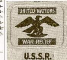
Šis ženklas yra duodamas kaip atžymėjimas darbininkui, 14 lietuvių gavo jį.

Asmeniniai daug draugų pasizadėjo rašinėti, tikiu, kad tie pažadai bus įvykdyti. Draugės, daugiau parašy-kite, juk visos dirbate, nors nemažai jau rašote, bet rei-škėtų daugiau rašyti. Žinau, kad visos galite rašyti. Tada mūsų skyrius būtų įvai-rnesnis. —J. S.