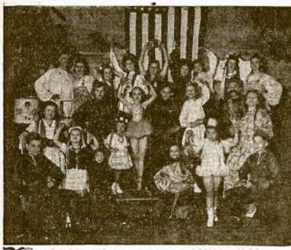
GRAŽIOS DAINOS, ŠOKIAI, MUZIKA; VAIDINUS PARINKTI ARTISTAI IR DAINININKAI

Sekmadienį Chicago's ir apylinkių lietuviai turės pramogą kokios iki šiol neturėjo.