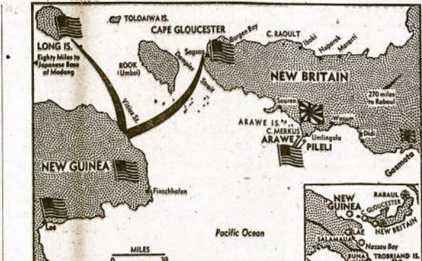
Vieno karo fronto Pacifike žemėlapis. Jame atžymėta vakarinė dalis New Britain salos kur šiom dienom mūsų jėgos padarė invaziją ir ištrėnkė japonus iš svarbaus punkto Gloucester lėkyvulį. Šioj salos dalyj mūsų kariai jau turi pačm bent du aerodromu, iš kur jau daužoma pati svarbiausia japonų bazė rytiniame salos kampe Rabaul.

Jis netyčia pasakė, kad buvusi prie tautininkų režimo Lietuvos vėliava nebuvo