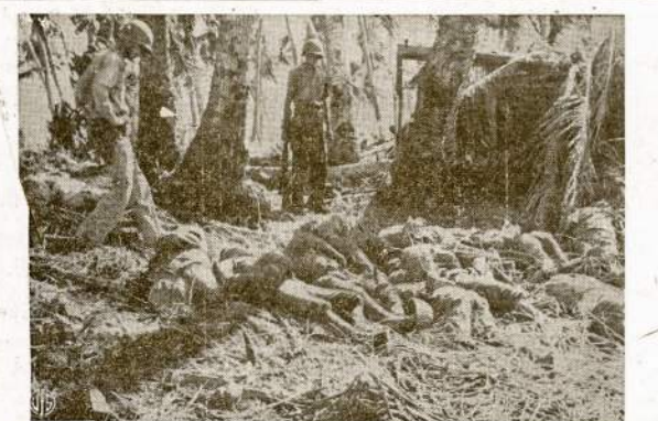
Kruva japo kareivių lavonų Makin saloje, Gilbertų salyne, kada tą bazę užėmė mūsų kariai marina Japonų religija ir valdžia draudžia pasiduoti į nelaisvę, dėlto tiek daug jų užmušama.

(Viena kopija 25c. (Kanadoj—35c). Daugiau perkant duodame nuolaidas. — Administracija).