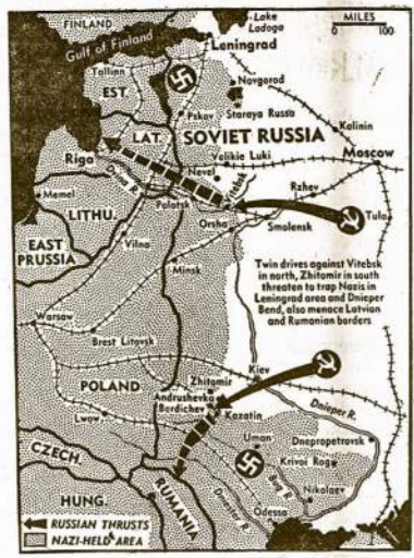
žemėlapis, kuris parodo galingą raudonarmiečių ofensyvą dvejose punktuose. Pasisekus šiam ofensyvui didžiulės nacių armijos būtų atkirtos Dniepro žemupyje ir Leningrado srityje.

Reikia atsiminti, jog Sovietų ataka nebus koncentruota tik Vitebsko-Nevelio apylinkė, vokiečių šiauriniame fronte. Tas gal bus svarbiausias žygis, bet kiti veiksmai parems. Į pietus, Sovietai jau artinasi prie Baltijos ir objektyvas ten yra Minskas, svarbiausia vieta prie vienos iš dviejų gelžkelio linijų, kuri užlaiko vokiečių poziciją Baltijoje — Varšavos-Smolensko kelias. Į šiaurę, Sovietai gal užpuls dvi tvirtoves prie Ilmen ežero — Novgorod ir Staraja Russa, su tolesniu objektyvu Pskov prie kitos svarbios gelžkelio linijos — Varšavos - Dvinsko - Leningrado. Šie bus remiantieji veiksmai sulaukyti vokiečių