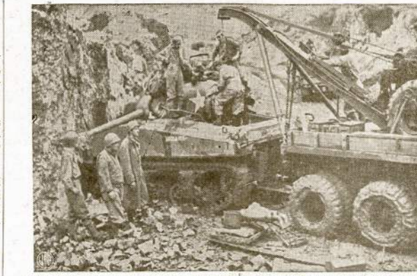
Mūsų penktosios armijos militarinė "kalvė" visai arti karo fronto Italijoje. Čia atgabunami mūšiniai ir nacių aplaūžyti karo įrankiai ir iš keių sugadintų padaromas bent vienas geras, kuris tuojaus pakinkomas darban stumti okupantus nacių toliau į šiaurę.

Toliau randame dar visą eilę "kovos lapelių" ir kitų sieminių laikraščių. Yra ir šaržų bei karikatūrų siemi-