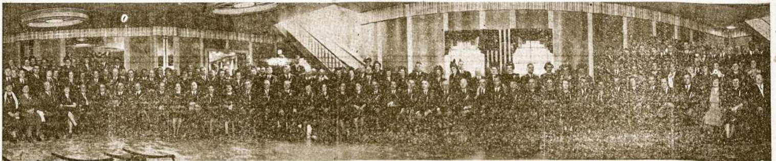
Delegatai Demokratinio Lietuvių Suvažiavimo, įvykusio 1943 m., Gruodžio 18-19 dd., New Yorke