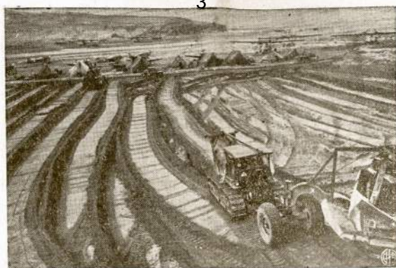
Mūsų karinio laivyno konstruktoriai (Seabees) paruošia vieškelius ir orlaivių laukus Adak saloje, Aleutų salyne, netoli Alaskos. Japonai iš ten jau ištrinkti ir tos bazės netrukus gal bus panaudotos tolimesniai bombardavimui japonų.

to nuo 1-mo Apskričio. Raportavo, kad ir 1-mo Apskričio nekurius kuopos silpnai veikia, mažiau narių turi, kad yra tam įvairių priežasčių. Raportas tapo priimtas.